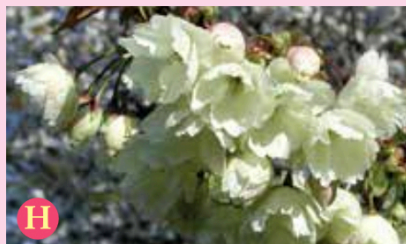
H ウコン (鬱金)

カンヒザクラ群の園芸品種で、アマギヨシノとカンヒザクラを交配して作られました。花は中輪で一重咲きです。花びらに小ジワがあるのが特徴です。