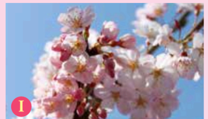
I エドヒガン (江戸彼岸)

サトザクラの園芸品種で、淡黄緑色をした八重咲きの花を咲かせます。ウコンの根茎を使って染めた色に似ていることから名前がつけました。花の色がめずらしいことから、日本のみならず外国でも人気があります。