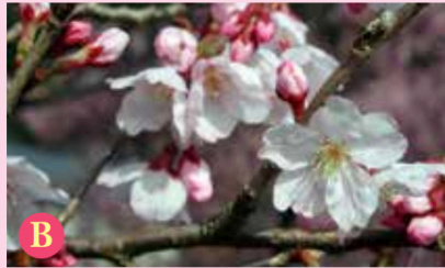
B コシノヒガン (越の彼岸)

サトザクラの八重咲きで、八重桜の代表とも言われます。花弁が多く、沢山の小花が集合して咲くので、枝が重みで垂れ下がっています。桜湯や慶事の桜茶は、この花を塩漬けたものです。