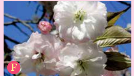
F フゲンゾウ (普賢象)

ヤマザクラ群の園芸品種で、花びらは大きく2cmぐらいあり、散る時は風に舞う蝶のようにも見えます。日本では絶滅したと思われていましたが、昭和初期、イギリスの桜研究者のもとにあるのが発見され、戻ってきました。