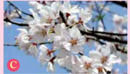
C コヒガン (小彼岸)

エドヒガン群の野生種で、花は水平に開き、淡紅色です。エドヒガンとキンキマメザクラの自然交雑種といわれています。県内では、新種が発見されています。