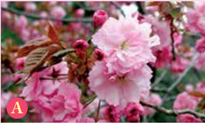
A カンザン (関山)

サトザクラの八重咲きで、八重桜の代表とも言われます。花弁が多く、沢山の小花が集合して咲くので、枝が重みで垂れ下がっています。桜湯や慶事の桜茶は、この花を塩漬けたものです。