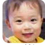
田村 楓真 (2歳・出町)