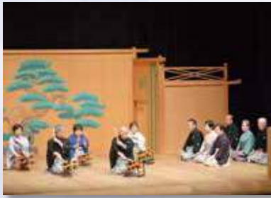
砺波市文化祭謡曲大会

現在、大会は春季と秋の文化祭謡曲大会と年間二回です。春季大会は従来各地区持ち回りで開催しておりましたが、令和三年からは庄川学習センターで行っています。会員は日ごろ市内の様々なグループで稽古に励んでいます。砺波