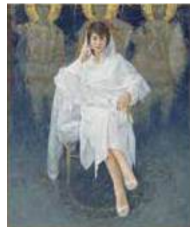
藤森兼明 《アドレーション・ デミトリオス》 2004年