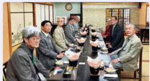
安城文化協会の皆さんとの交流会

安城文化協会とは、平成24年度から美術・民謡・文芸等を通じて交流を深めており、今後とも末永く市民文化交流を進めてまいります。