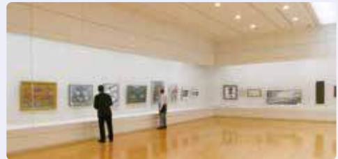
砺波市美術協会員の作品展示

5月12日から24日にかけて、愛知県安城市で開催された「安城文化協会創立80周年記念事業 文協祭美術展（砺波市美術協会交流展）」に、砺波市美術協会会員14人が出品し合同展示しました。