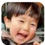
長瀬 快李 (3歳・若林)