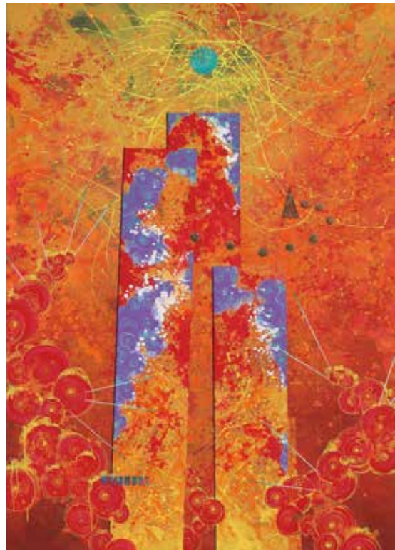
小西信英 《大悲の空》 2002年