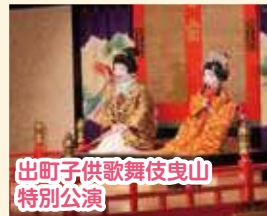
出町子供歌舞伎曳山 特別公演