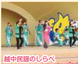
越中民謡のしらべ