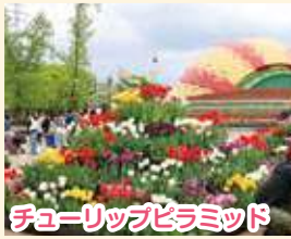
チューリップピラミッド