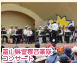
富山県警察音楽隊 コンサート

今年のテーマは「想いをつなぐと なみ花物語」。2026と なみチューリップフェアは75回目の節目の開催となりました。これまでフェアを支えてきた先人の想いを受け継ぎながら、市民の皆さま、関係者、来場者の想いをつなぎ、未来へ向けてさらなる魅力向上を目指すという願いが込められました。