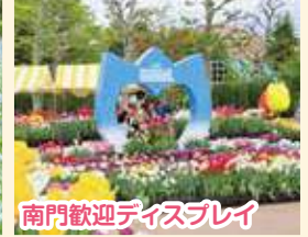
南門歓迎ディスプレイ

今後、チューリップフェアを通して花と緑のまちなみの魅力を広く発信し、多くの方々に愛される催しとして発展させてまいります。 準備から閉幕までご協力をいただいた多くの皆さまに感謝申し上げます。