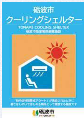
▲この表示が目印です

「クーリングシェルター（指定暑熱避難施設）」は「熱中症特別警戒アラート」が発表されたときに涼しく過ごせる場所として開放する施設です。