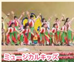
ミュージカルキッズ