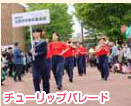
チューリップパレード