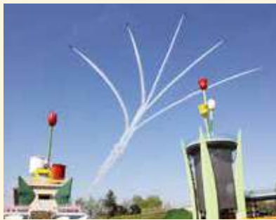
第70回の新旧ツインタワー