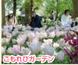
こもれびガーデン