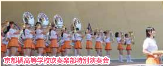
京都橘高等学校吹奏楽部特別演奏会