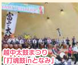
越中太鼓まつり [打魂鼓inとなみ]