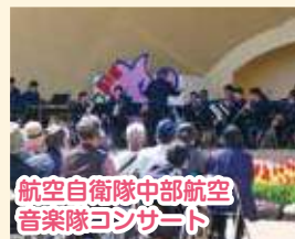
航空自衛隊中部航空 音楽隊コンサート