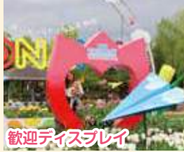
歓迎ディスプレイ