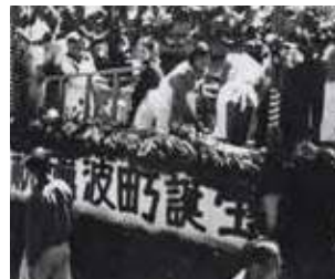
第1回チューリップフェア 合併した町村から選ばれた 「ミス・チューリップ」が特製の 「花自動車」に乗ってチューリップ を各地区で贈り撒く「チュー リップ百万ドル行進」

出町・庄下・五鹿屋・林・油田・中野の1町5村が1952年に町村合併し、「砺波町」が誕生しました。これを祝して第1回チューリップフェアが開催されました。