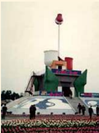
チューリップタワー(建設当初)