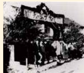
第1回チューリップフェア 会場入口に飾られた手作り アーチ