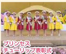
プリンセス チューリップ表彰式