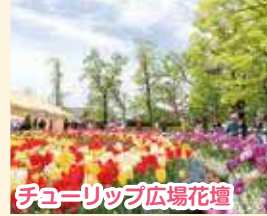
チューリップ広場花壇