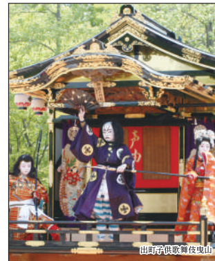
出町子供歌舞伎曳山