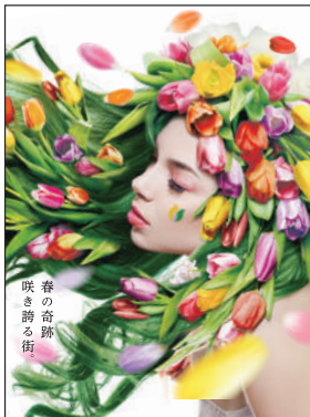
咲き誇る街 春の奇蹟