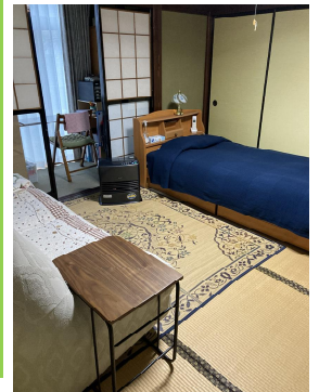
[ ママの休息の部屋 ]