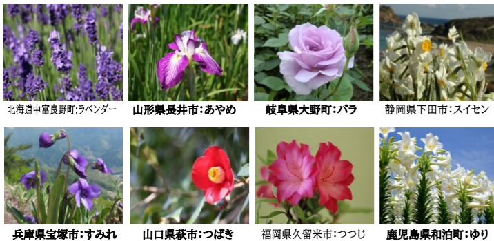
北海道中富良野町:ラベンダー 山形県長井市:あやめ 岐阜県大野町:バラ 静岡県下田市:スイセン 兵庫県宝塚市:すみれ 山口県萩市:つばき 福岡県久留米市:つつじ 鹿児島県和泊町:ゆり

・フラワー都市交流連絡協議会は花を通じたまちづくりを目指す全国9都市が加盟。今年は砺波市に集結し市民交流を開催 ※砺波市を除く加盟都市は以下のとおり 〔北海道中富良野町、山形県長井市、岐阜県大野町、静岡県下田市、兵庫県宝塚市、山口県萩市、福岡県久留米市、鹿児島県和泊町〕 4/25: 我がまち紹介 (全国9都市の紹介) [文化会館大ホール] 4/26~27: フLOWER都市交流物産展 [チューリップ広場]