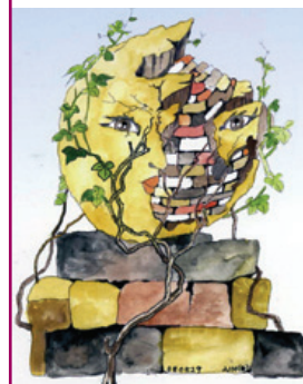
笹川むもん ドローイング作品