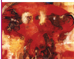
清原啓一 《争いを観る》1981