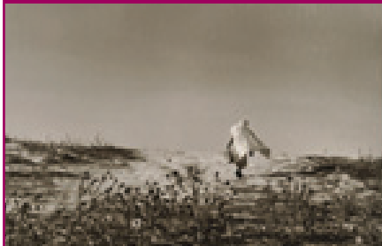
高道 宏<風 Meknés>1991