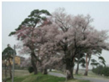
松川除のエトヒガン

水資料館から春の便りです。庄川周辺を美しく彩る桜の資料を写真つきで分かりやすく展示。多くのみなさんに桜に親しんでいただくこの時期ならではの企画展です。