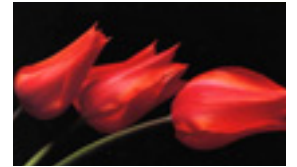
秋山庄太郎<ダイアノ>1994