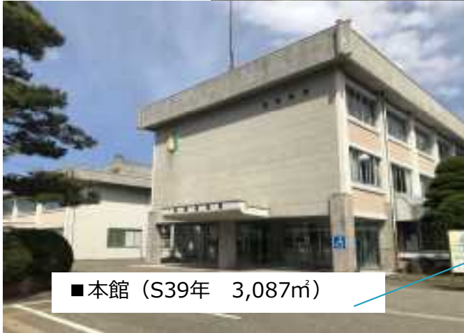
■ 本館 (S39年 3,087㎡)