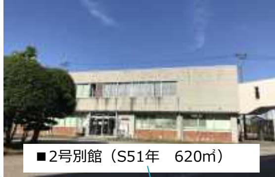
■ 2号別館 (S51年 620㎡)