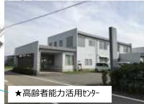
★ 高齢者能力活用センター