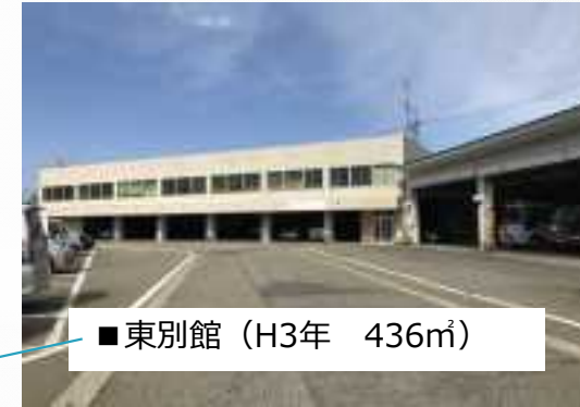
■ 東別館 (H3年 436㎡)