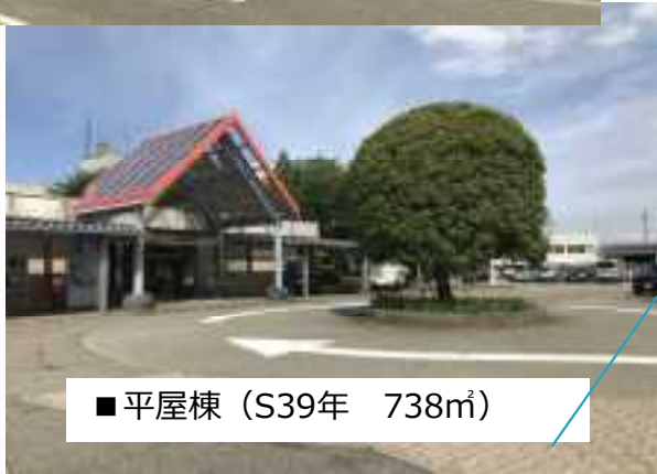
■ 平屋棟 (S39年 738㎡)