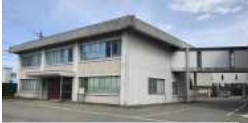
■ 1号別館 (S48年 640㎡)