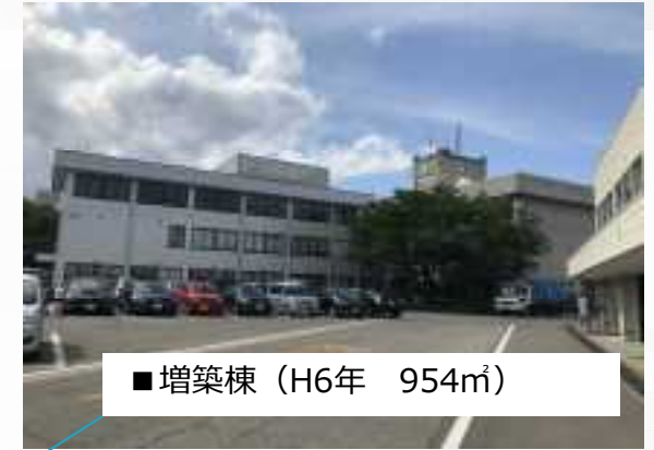
■ 増築棟 (H6年 954㎡)