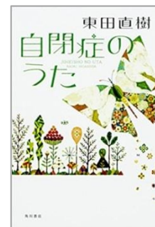
『自閉症のうた』 東田直樹/著 KADOKAWA

中学2年生の藤崎空良は、自分の出自に悩むクラスメイトの高杉翔と、とある出来事をきっかけに親しくなります。翔が住むのは、外国人や世間からはみ出した人が多く集まる町・新大久保。翔の隣人ひとみさんやアパートの主キムさんなど、偏見に負けずたくましく生きる人々との出会いが、父親の失踪・学校の人間関係で曇っていた空良の日常を変えていきます。心が晴れる青春小説です。