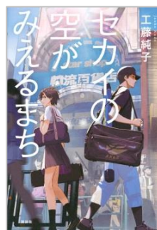
『セカイの空がみえるまち』 工藤純子/著 講談社

潔癖症のエミリアがこのサバイバルをどう乗り越えるか、4人の関係の変化にも注目しながら読むと面白いです。