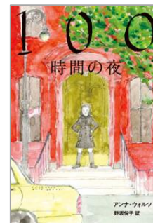
『100時間の夜』 アンナ・ウォルトツ/作 野坂悦子/訳 フレーベル館

ラーメン井やかき氷の旗にも文様は描かれています。何気なく目にしている模様も、意味のある文様なのかもしれませんね。