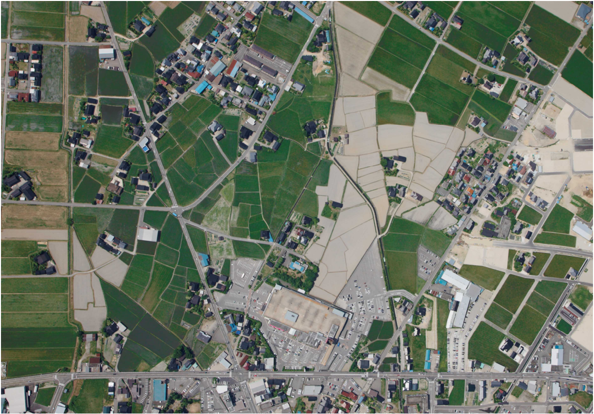
H 2 0 中神地区全景