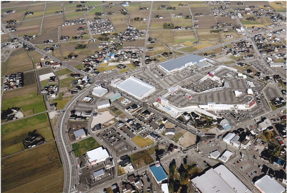
H 2 7 中神地区全景