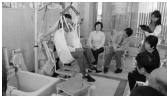
介護機器を体験する参加者

電動ベッドや車いすに試乗することで、介助される側の体験もしました。見慣れない介護用品の数々に、使用方法などを熱心に質問する方もありました。