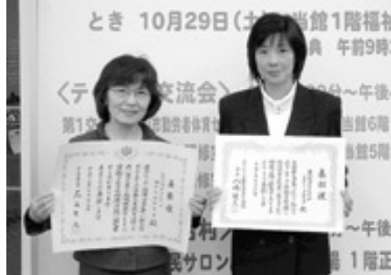
受賞されたカナリヤグループとラブリーグループ