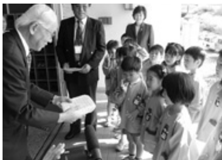
五鹿屋幼稚園児たちがお米を贈呈しました