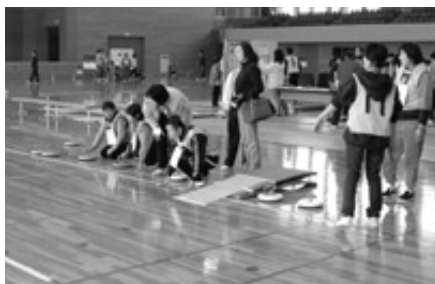
砺波市、小矢部市、南砺市の社会福祉協議会が主催 標的めかけ狙いをさだめて