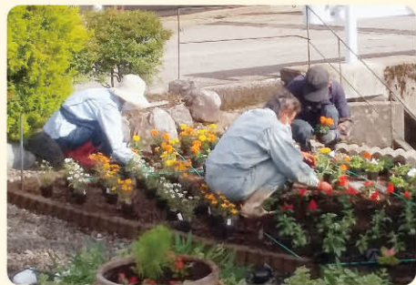
いよいよデビューです

そして六月五日(土)、いよいよ植付けです。この子たちの美しく咲き揃う姿をぜひ見に来て下さい。