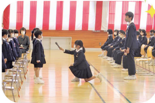
はじめまして よろしく