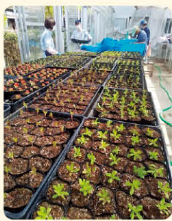
温室育ちの箱入り娘たち