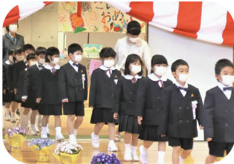
緊張して入場します