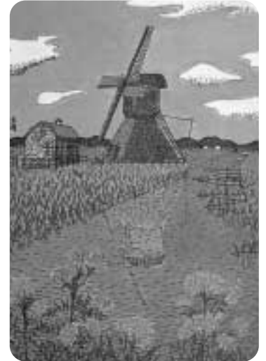
オランダの風車 水彩画/1961年 ©清美社

前売券販売所 四季彩館 フラワーランドとなみ 美術館 文化会館 庄川生涯学習センター サークルKサンクスほか