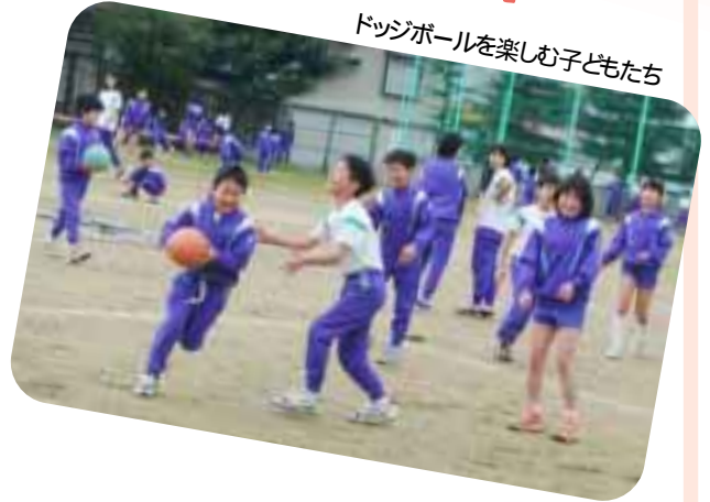
ドッジボールを楽しむ子どもたち

また、高学年の子どもたちは、リーダーとしての自覚をもち、「下の学年の子どもたちが楽しんでいるかな」ということに気を配り、活動していたことが分かりました。