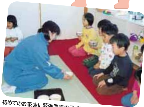
初めてのお茶会に緊張気味の子どもたち

桑先生の指導のもと、しばらくの間ではありましたが、皆で和やかな時間を過ごしました。