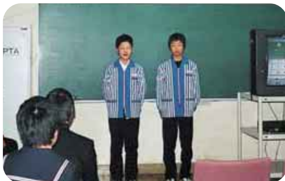
ローソンでの体験を発表する生徒たち