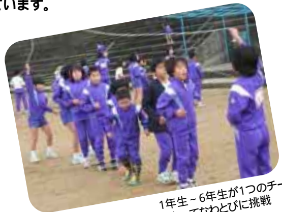
1年生～6年生が1つのチームになってなわとびに挑戦

異年齢で遊ぶことが少なくなった子どもたちに、遊びのおもしろさを存分に味わせてやりたいものです。次回、子どもたちの声をもとに「なかよしジャンボタイム」の計画を立てたいと考えています。