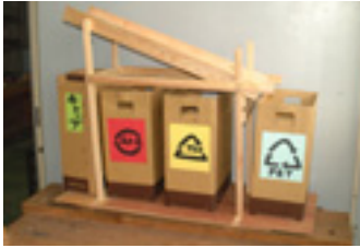
富山県教育長賞受賞作品

各小学校で配布される申込書に必要事項を記入して、3月23日（木）まで各小学校の担任の先生に提出してください。