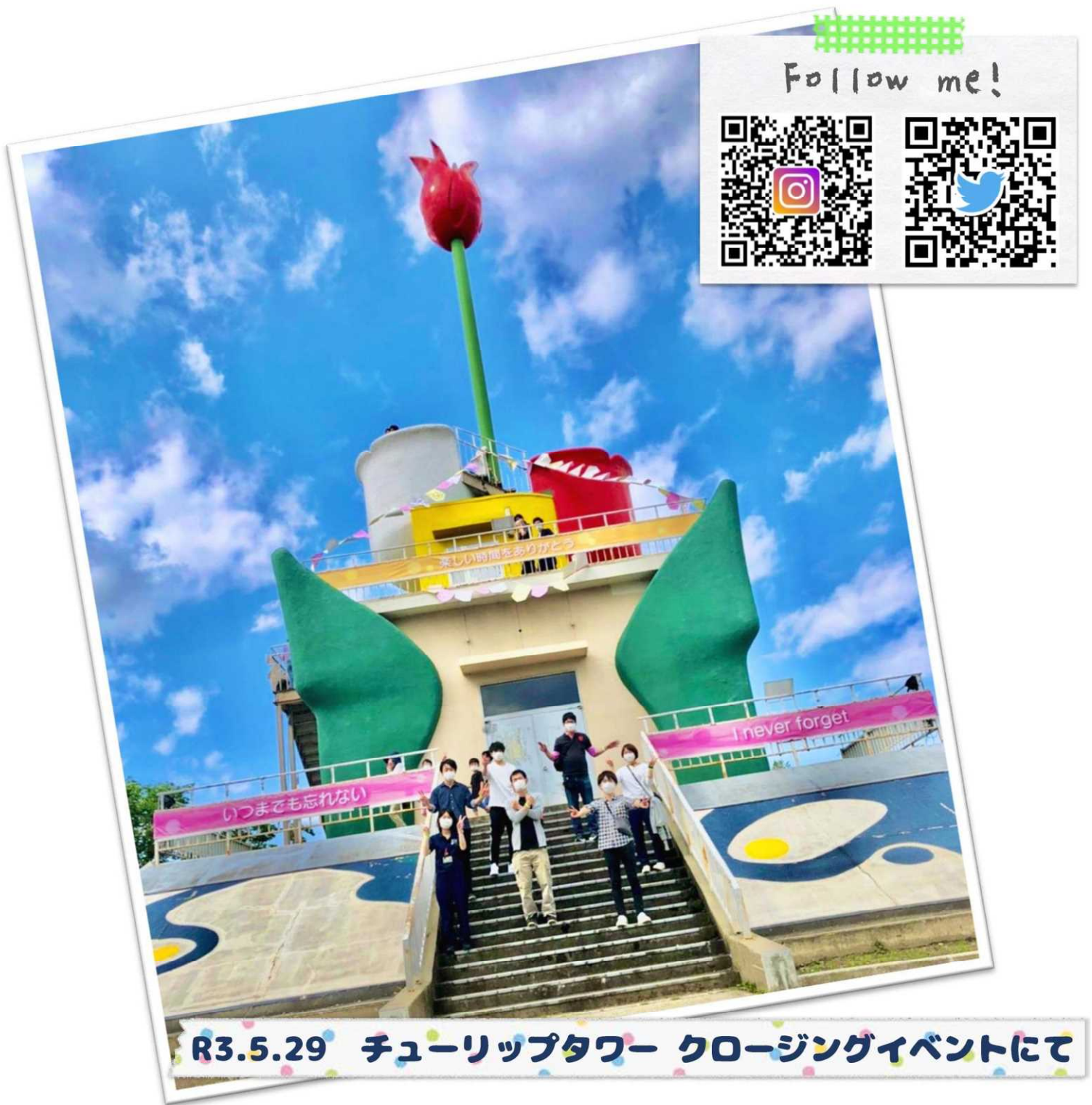
R3.5.29 チューリップタワー クロージングイベントにて