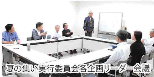
夏の集い実行委員会各企画リーダー会議

それでも『砺波市の各地区で抱えている課題はそれなりに違うはず。地区毎に事業を検討することは必要。』『金額の問題ではない、地区のために自分たちで考