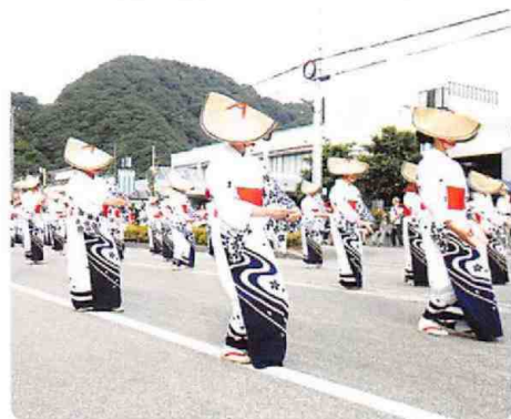
6月2日庄川温度町流し

六月一日、二日の両日、天候にも恵まれ、庄川観光祭が賑やかに開催されました。 新元号「令和」の幕開けで、夜高行燈では新しい出し物として「夜高の大谷」が試まれ、道の両側に二十四基の行燈が勢揃いし、おおいに盛り上がりました。 また、友好都市であるむかわ町が昨年震災に見舞われたことへの激励で各行燈の絵柄には「がんばろう！むかわ町」が描かれていたのが今年の特徴で多くの人の心に残っていると思います。