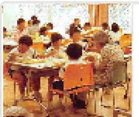
第一常会・学校訪問 “小学生と集う”(5/30)