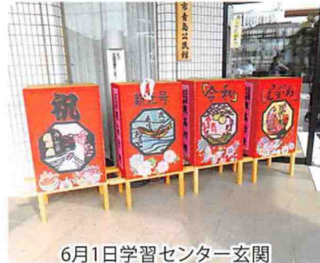
6月1日学習センター玄関 (小学生製作とっぺ行燈)