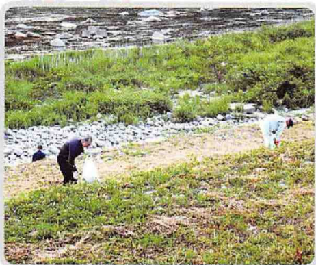
観光祭後のごみ拾い (中之島長寿会)(6/3)