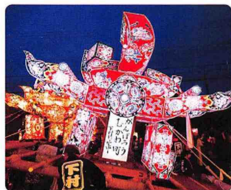
がんばろう!むかわ町