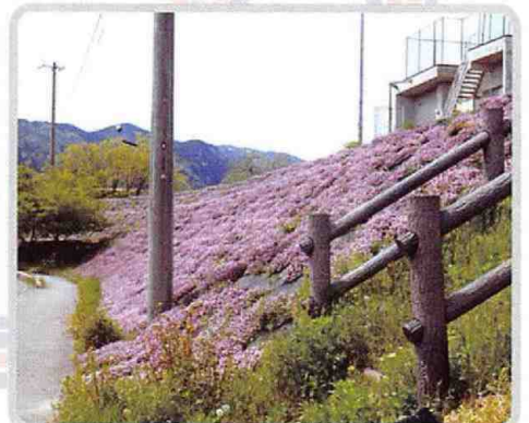
タイムロンギカウリス開花 (4/28)