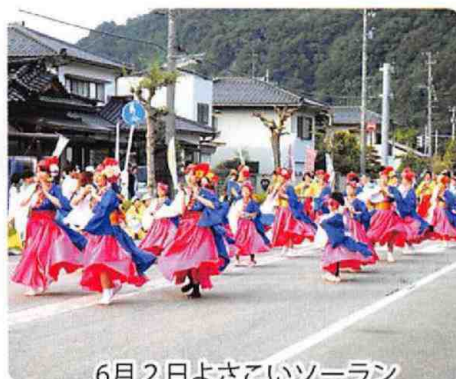
6月2日よさこいソーラン (庄川もりあげ隊)