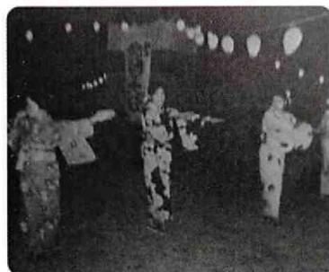
昭和47年 旧庄川町 役場広場での盆踊り (庄川町史上巻より)

『著名人の講演会などやったから』『地域外の人に来て貰えて、青島の良さを知ってもらうものは。』『もっと、防災用の備品を整備する。例えば発電機とか』『発電機を買うのなら、それを活用できるイベントを企画できないか』『昔やっていた青島全体の盆踊りを復活したら』『盆踊りだけでは、今は人が集