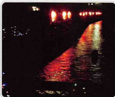
二万石用水とっぺ行燈点火 (5/26)