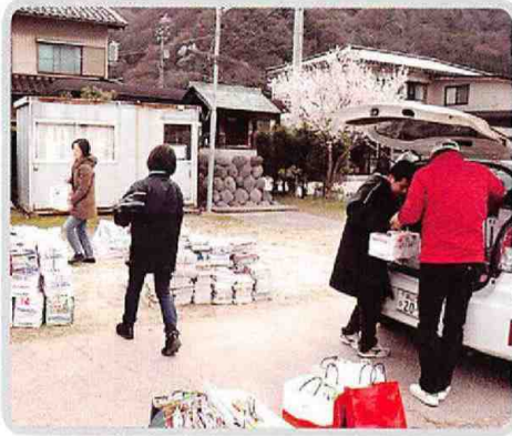
婦人会資源ごみ回収 (4/7)