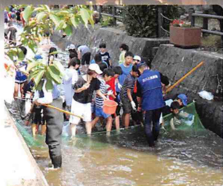
6月2日ニジマスつかみ

六月一日、二日の両日、天候にも恵まれ、庄川観光祭が賑やかに開催されました。 新元号「令和」の幕開けで、夜高行燈では新しい出し物として「夜高の大谷」が試まれ、道の両側に二十四基の行燈が勢揃いし、おおいに盛り上がりました。 また、友好都市であるむかわ町が昨年震災に見舞われたことへの激励で各行燈の絵柄には「がんばろう！むかわ町」が描かれていたのが今年の特徴で多くの人の心に残っていると思います。