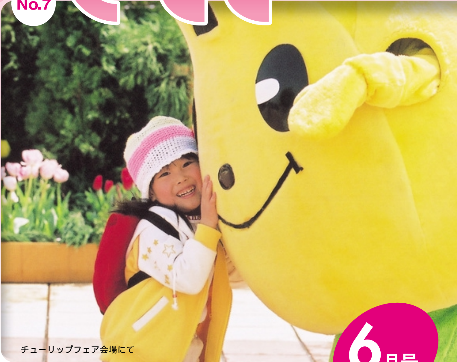
チューリップフェア会場にて