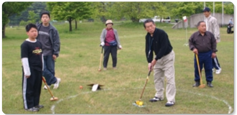
【梅檀野地区三世代交流事業】 5月15日、グランドゴルフ大会に約90名が参加。