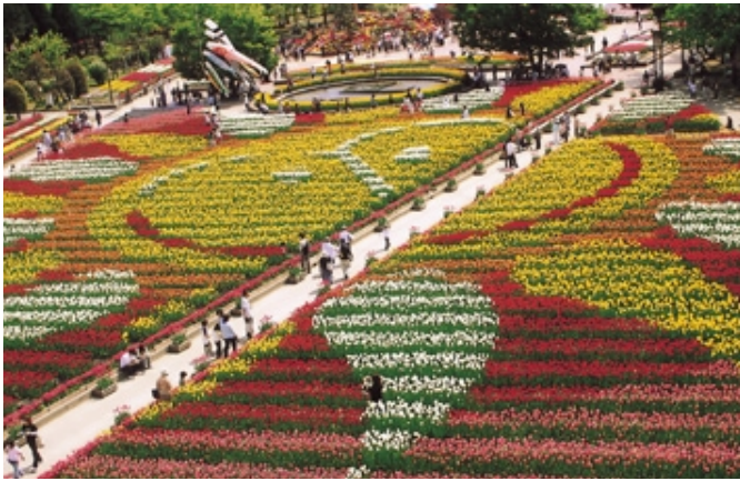
チューリップフェア期間中の大花壇