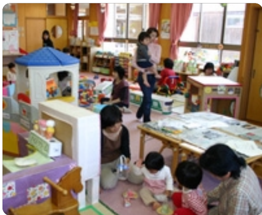
支援センターの様子