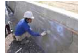
水路の補修・改修