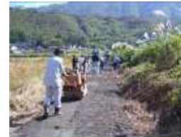
砂利農道をアスファルト舗