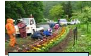
施設への花の植栽