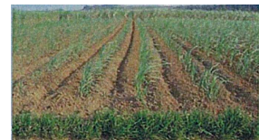
グリーンベルトの設置