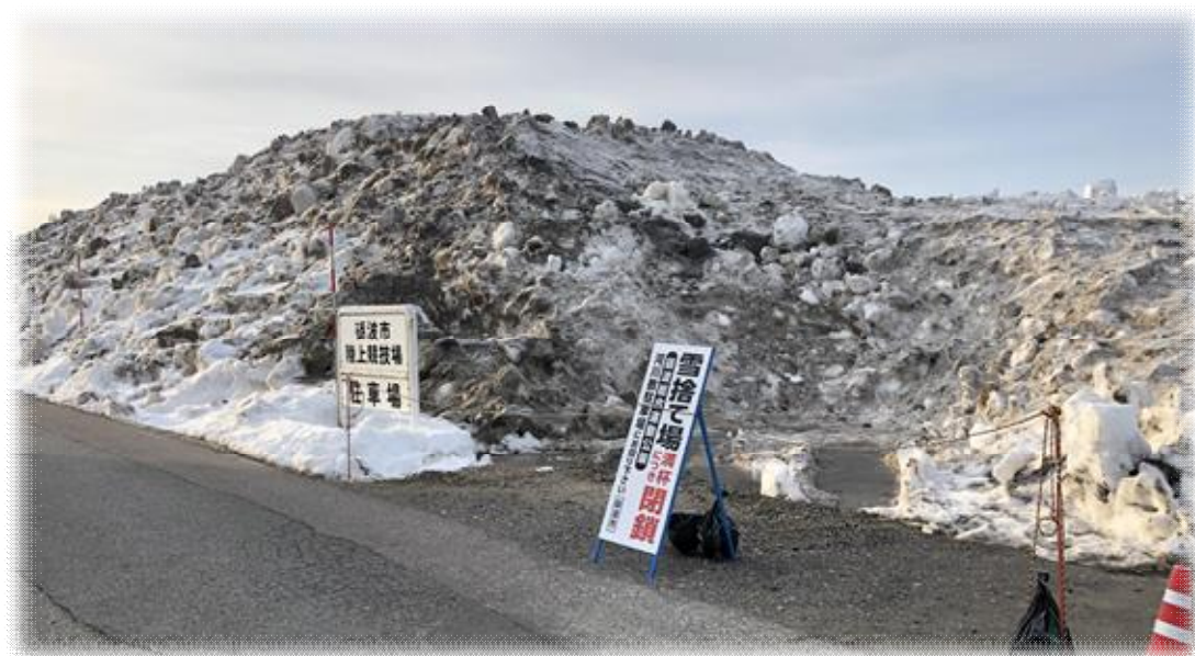
雪捨て場の様子（令和 3 年 1 月（砺波市深江地内））

工事現場からの排雪は、土砂やコンクリート殻などが混入しているため搬入禁止とする。