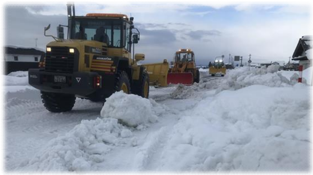
圧雪処理の様子（令和3年1月）