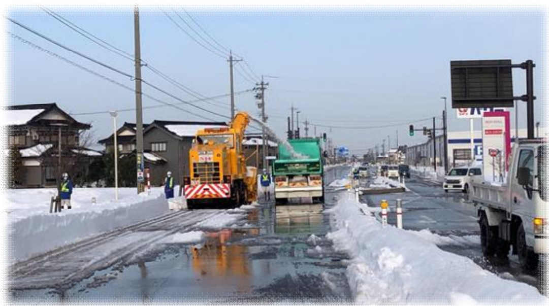
拡幅除雪・運搬排雪の様子（令和3年1月）