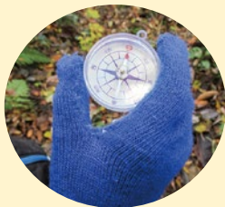
磁場ゼロで 不安定な磁針