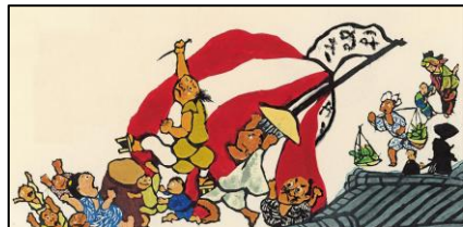
《花見じゃ そうべえ》2024

2026となみチューリップフェア特別展 「ファンタジーを染める たじまゆきひこ展」