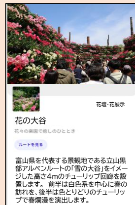
※スポット紹介画面イメージ