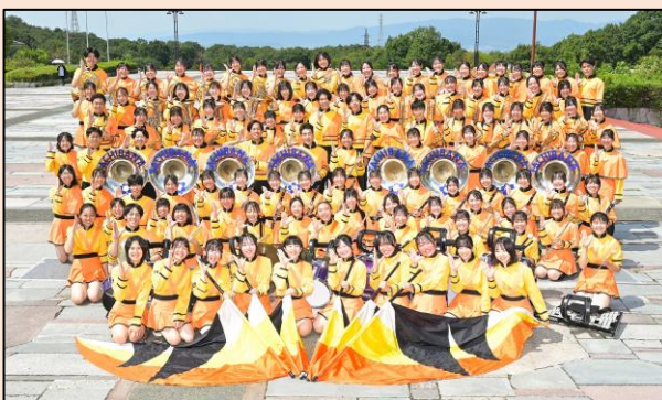
京都橘高等学校吹奏楽部

金 額:2,000円(全席指定) 販売開始:令和8年3月29日(日)9:00～ ※文化会館チケットサービス(web)