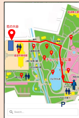
※目的地・モデルルート検索イメージ