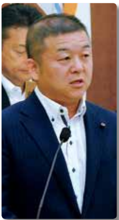
やまもと あつし 議員 山本 篤史