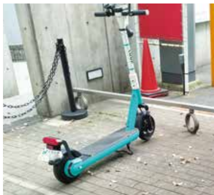
公道走行できる電動キックボード

答 教育委員会事務局長 体育施設の熱中症対策は大型扇風機などに対応し、特別教室のエアコン設置を順次進めていく。