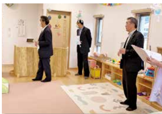
外光をふんだんに取り込んだ明るい部屋

事業者の「となみ中央福祉会」は、これまでも「ちゅーりっぷ認定こども園」、「あぶらでん認定こども園」そして「たかのす認定こども園」を運営されています。園内の施設見学後、園長並びに職員の方と、運営面などについて意見交換を行いました。