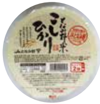
となみ野パック米