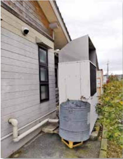
エアコンの室外機

答 社会福祉課長 シルバー人材センターの事務所や作業場のある「シルバーワークプラザ」に設置のガス式エアコンの室外機改修工事を行うものであり、設置から25年経過しており、室外機の振動が大きくなり安全装置が誤作動を頻繁に起こすことから交換を要するもの。