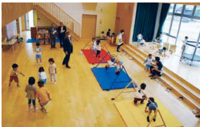
園内で元気に活動する園児たち

この園は、これまで庄川地域にあった4つの市立保育所を統合し、民間事業者に運営を委託する「認定こども園」として整備したものです。