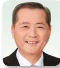
副議長 有若 隆