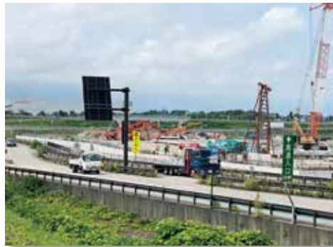
造成工事の進む柳瀬工業団地

答 商工観光課長 第一団地・第二団地ともに不動産鑑定士による鑑定評価を令和2年度に行い、同価格としている。