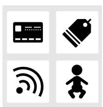
ピクトグラムの一例

答 企画総務部長 庁内に「新市誕生20周年記念事業検討委員会」を設け、マークの必要性も含め検討する。