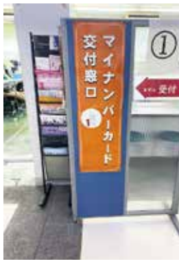
マイナンバーカード交付窓口

目標を定め、点検・評価・見直しを行っている。 問 国民健康保険税、子どもに係る均等割を無料化するよう県の議論をリードしてほしい