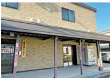
市立砺波総合病院発熱外来

いては、収入は新型コロナウイルス患者の受入病床確保に対する交付金が前年度より減少したものの、入院・外来収益とも増加、支出は物価高騰等により材料費等が増加したが、収支差額は1億5千6百万円余となり、3年連続黒字決算の見込みである。また、県の地域医療構想における総合病院の取組方針は、高度急性期医療に加え、「地域包括ケア病棟」や「訪問看護ステーション」、更に令和7年度に「緩和ケア病棟」を開設予定であり、砺波医療圏の中核病院として回復期・慢性期医療との連携や支援を行う多機能型の急性期病院を目指す。