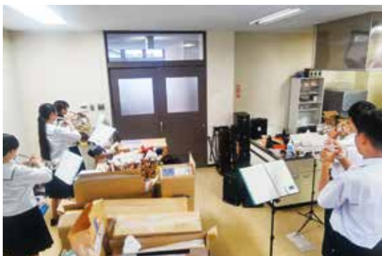
中学校部活動の一コマ