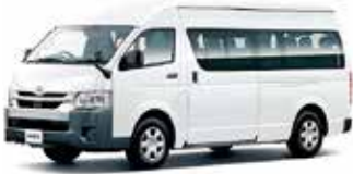
ミニマイクロバス

答 企画政策課長 補正予算には、ラッピング費用も含まれている。来年4月のダイヤ改正は、高校生の通学に合わせた改正も検討しているので、若い世代が乗りたくなるようなデザインを考えたい。