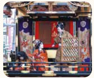
出町子供歌舞伎曳山祭 4月29・30日