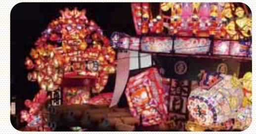
とらなみ夜高まつり 6月第2金曜・土曜