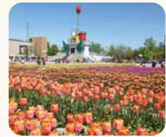
とらなみチューリップフェア 4月下旬～5月上旬